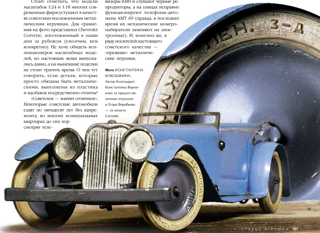
Фото КОНСТАНТИНА КОКОШКИНА. Автор благодарит Константина Верникова за предоставленные игрушки и Егора Воробьева — за модель Corvette.

визоры КВН и слушают черные репродукторы, а на улицах исправно функционируют телефоны-автоматы АМТ 69 (правда, в последнее время их механические номеронабиратели заменяют на электронные). И, конечно же, в ряду носителей настоящего советского качества — «прежние» металлические игрушки.