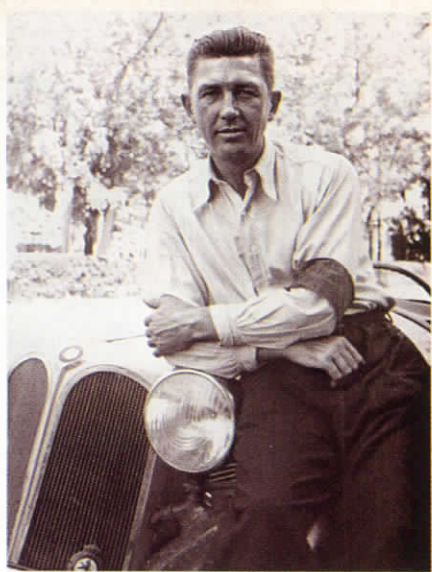
▲ Димитър Соколов - републикански и балкански шампион по автомобилизъм и мотоциклетизъм, 30-те години на XX век.