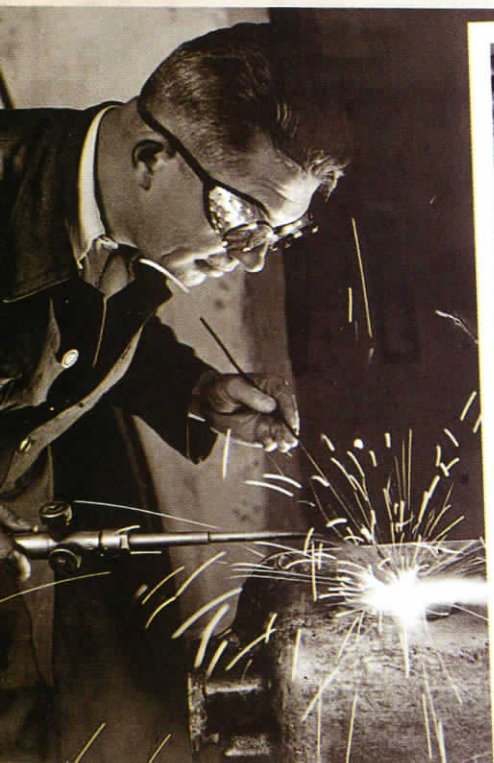
▲ Автомобилният състезател в своята работилница, 30-те години на XX век.