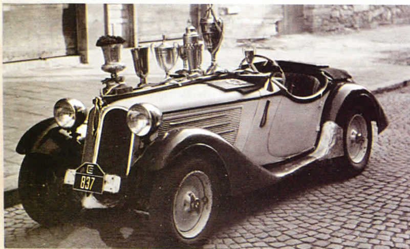
▲ Автомобилът BMW на Димитър Соколов и шампионските купи, 30-те години на XX век.