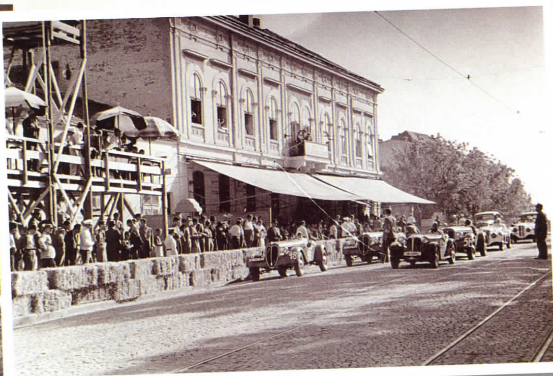
▲ Димитър Соколов на квалификацията за Формула 1 в Белград, 1939 г., BMW.